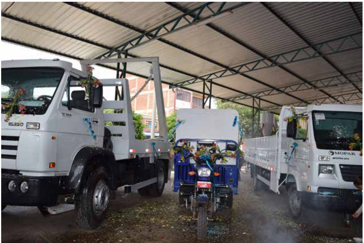
Equipos de recolección de residuos en Cliza.

Los proyectos deben contar con especificaciones técnicas ambientales para su fase de ejecución,