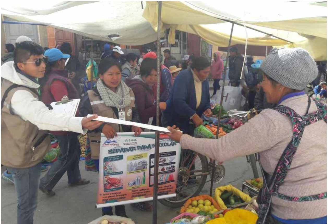
Sensibilización de brigadistas a vendedoras de la feria del mercado central de Villazón.