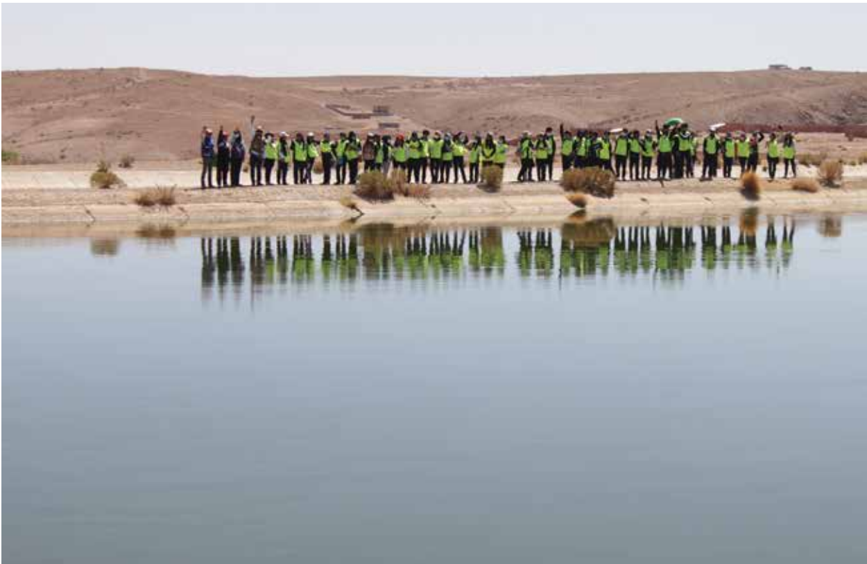
Visita de jóvenes a la PTAR de Villazón.