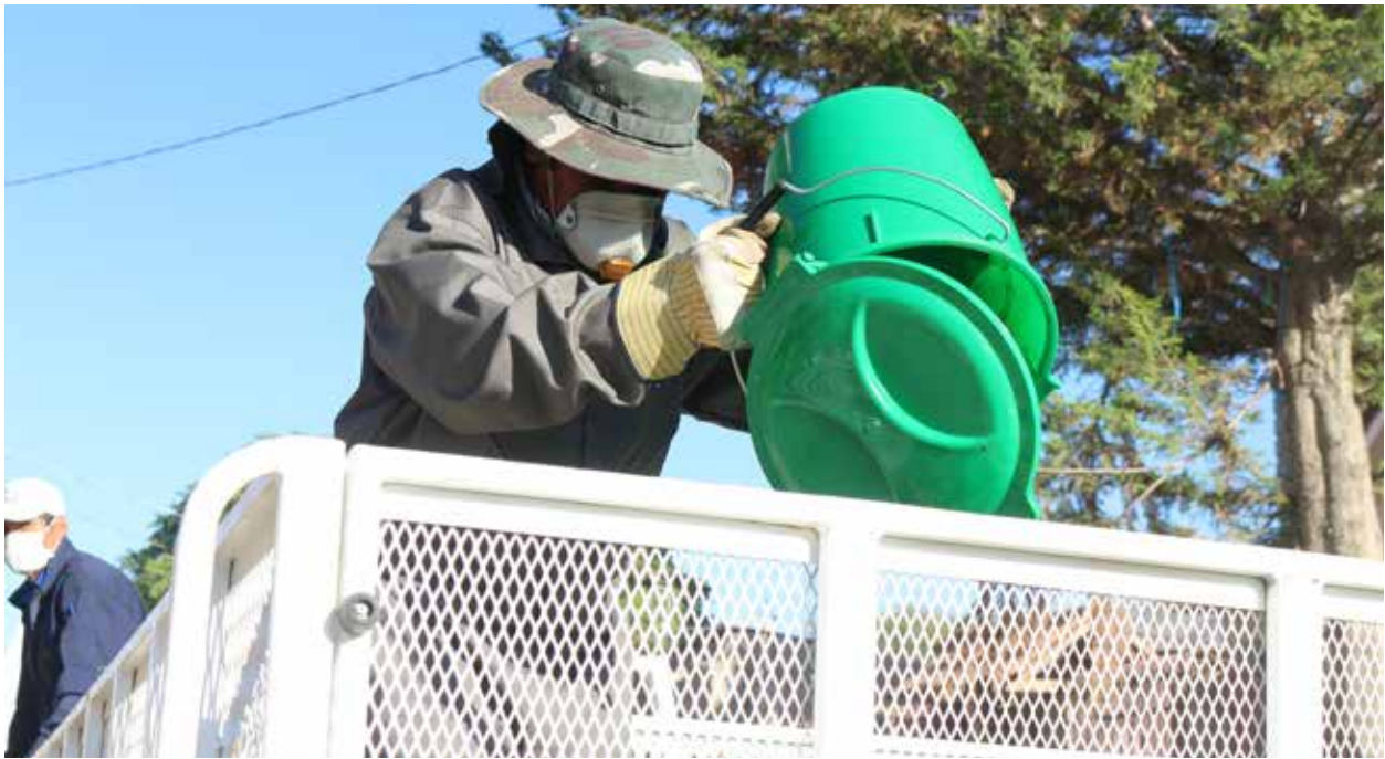
Recolección de residuos sólidos en Tolata.