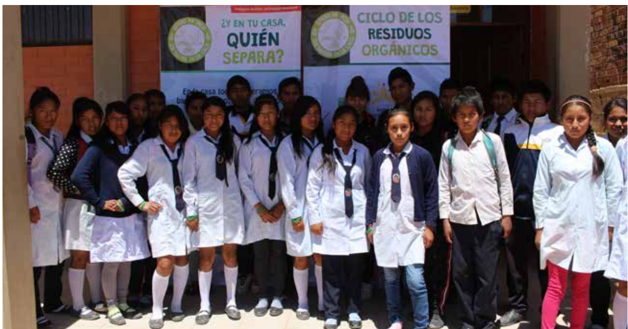
Dinámicas ecojuveniles en unidades educativas de Arbieto.

Para la disposición final ubicar sitios de acuerdo con la normativa vigente, que sean factibles desde lo técnico, ambiental, legal y social. El método de operación a diseñarse estará en función a la topografía del lugar, las características de los suelos y a las condiciones climáticas.