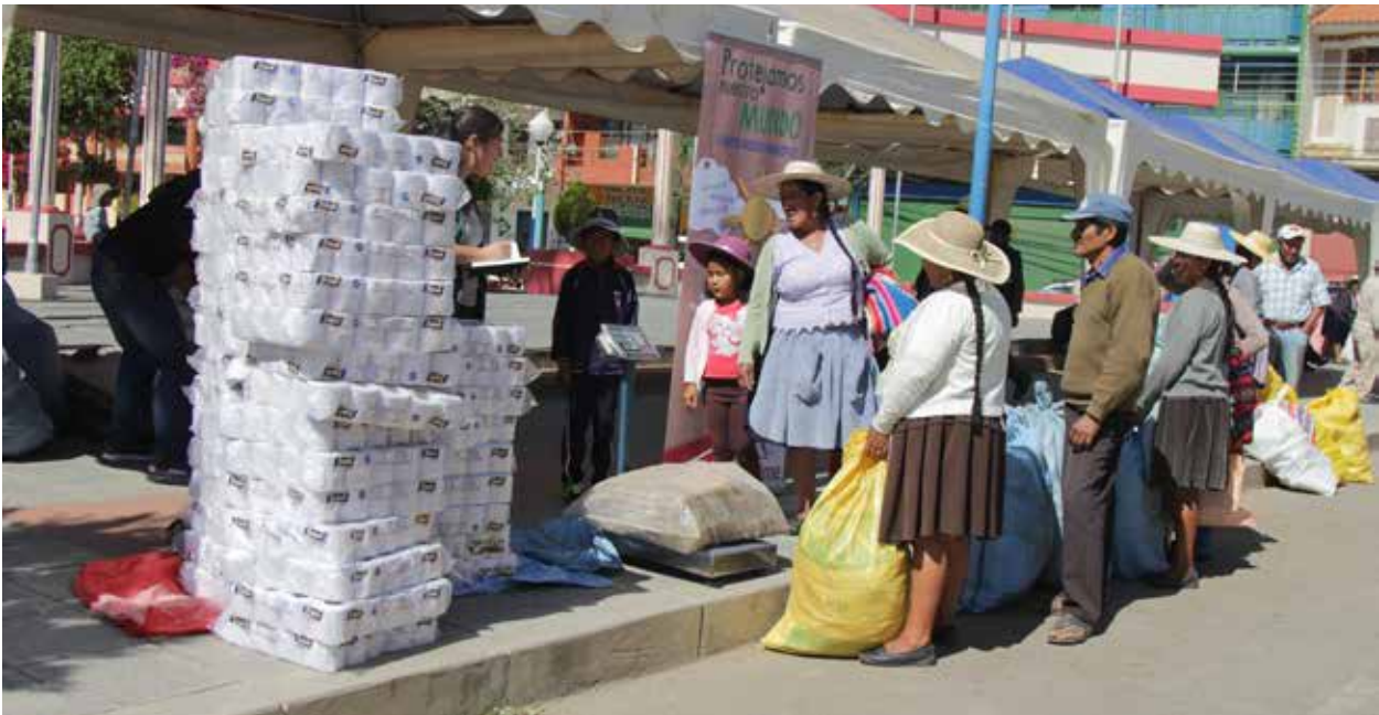
Feria del trueque ambiental en Cliza.