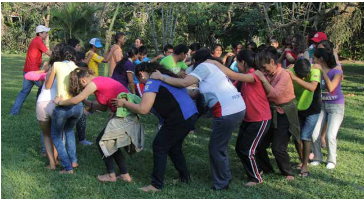
Campamento ambiental con jóvenes chaqueños.