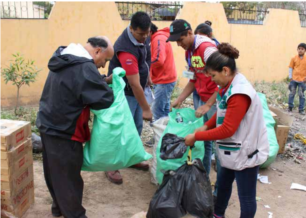
Concurso de acopio de residuos en unidades educativas de Villa Montes.