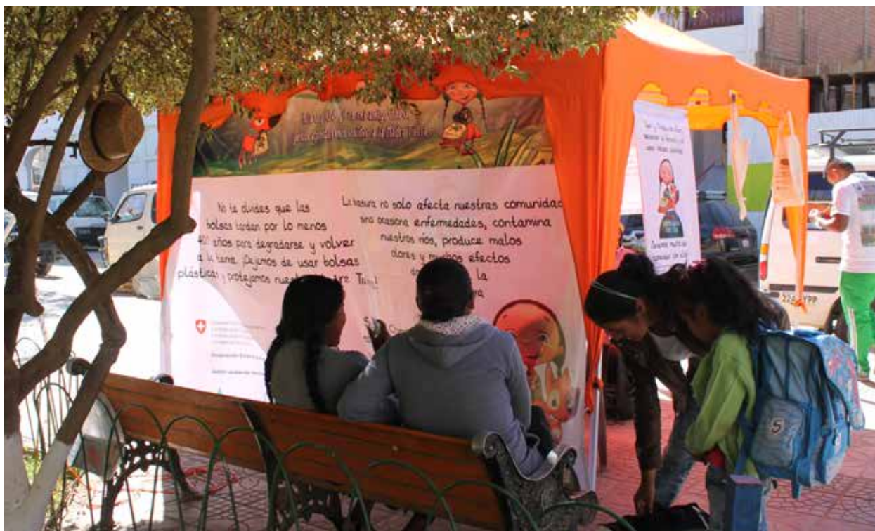
Campaña de la Madre Tierra en Cliza.