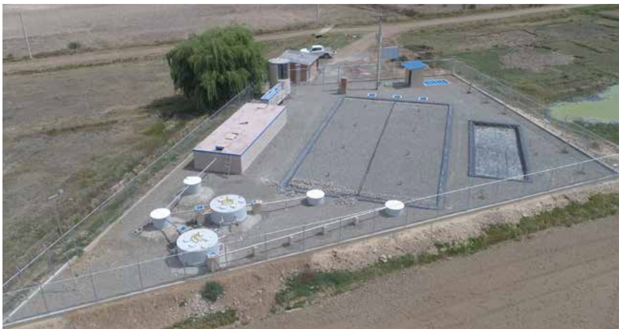
PTAR Huasacalle en el Valle Alto de Cochabamba.

fundamentales para proponer la cobertura de saneamiento al 100% como un estándar de calidad, es que forma parte de una meta enmarcada dentro de la Agenda Patriótica 2025 del Estado Plurinacional de Bolivia, aprobada como política del Ministerio de Medio Ambiente y Agua (MMAyA) y que responde a los Objetivos de Desarrollo Sostenible (ODS).