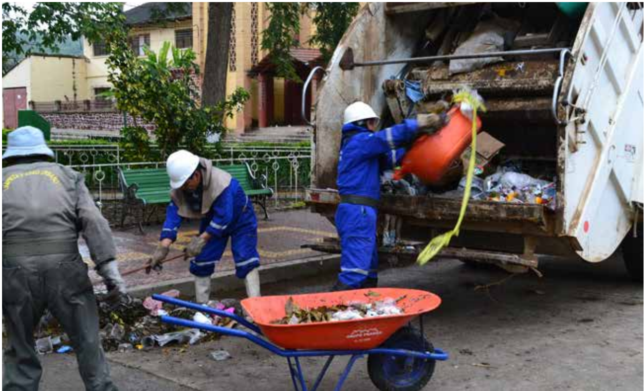
Servicio de recojo de residuos en Monteagudo.