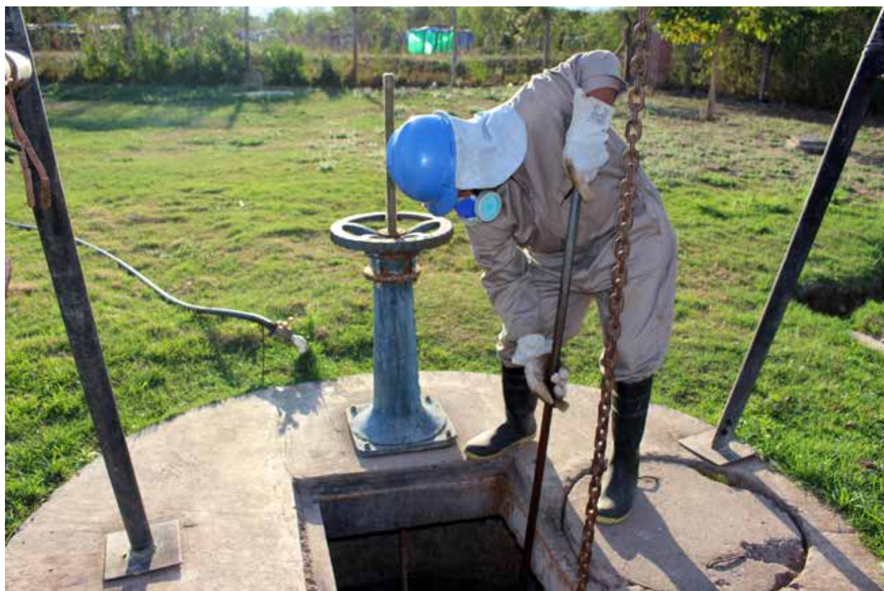
PTAR de Villa Montes.

Esta dimensión está ligada al acceso equitativo de toda la población a los servicios de aseo urbano, agua, saneamiento y gestión de residuos sólidos, con un enfoque de equidad social y participación activa tanto de hombres como de mujeres; la identificación e inclusión de grupos en