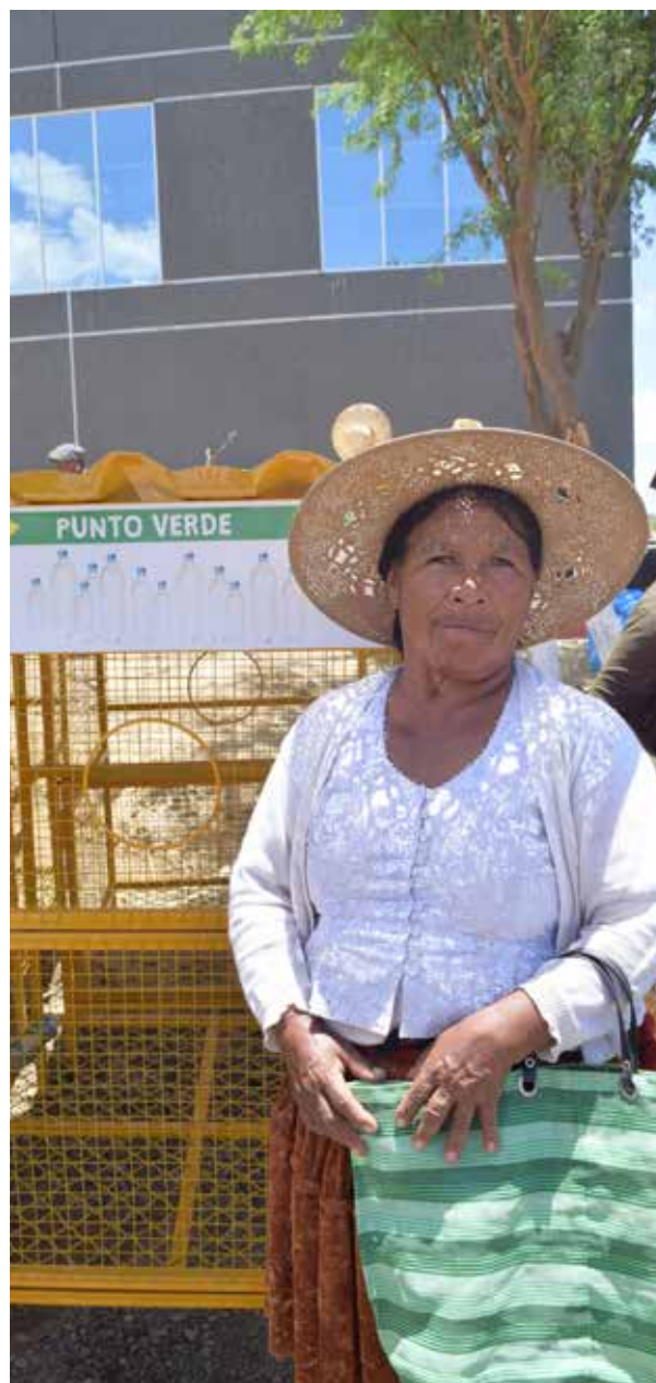
Una usuaria del Punto Verde en el Valle Alto de Cochabamba.