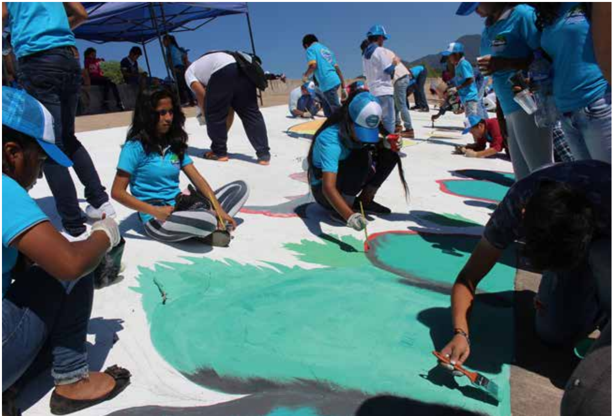
Mural con mensajes ambientales en la rivera del Pilcomayo.