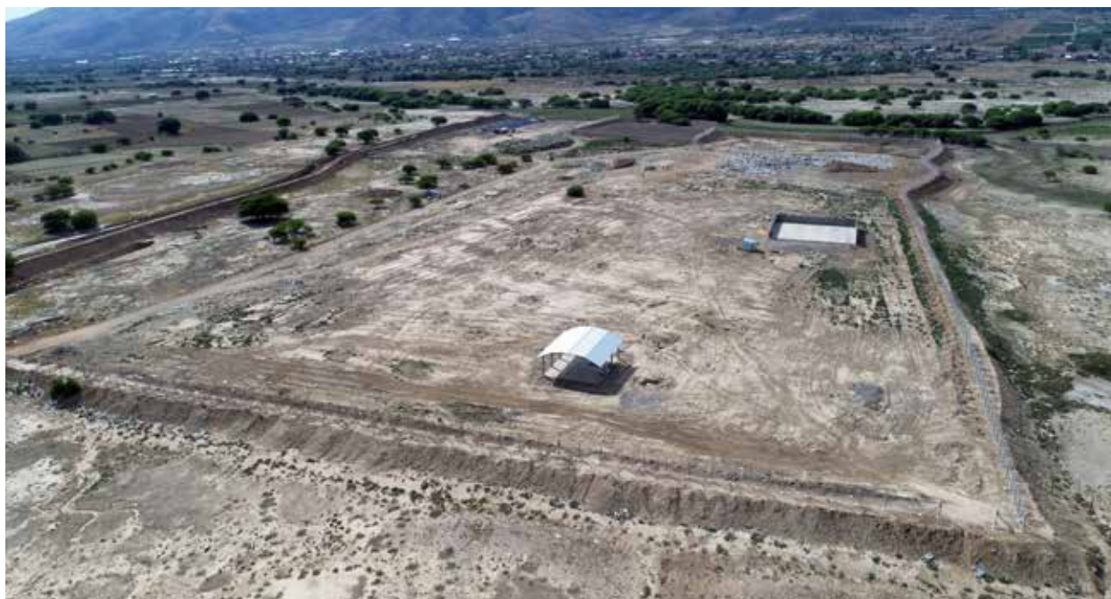
Botadero controlado en Cliza.