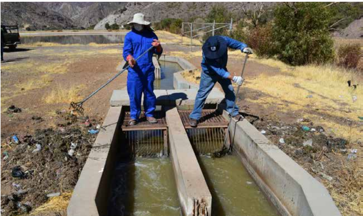
Obreros realizan el mantenimiento en la PTAR de Tupiza.