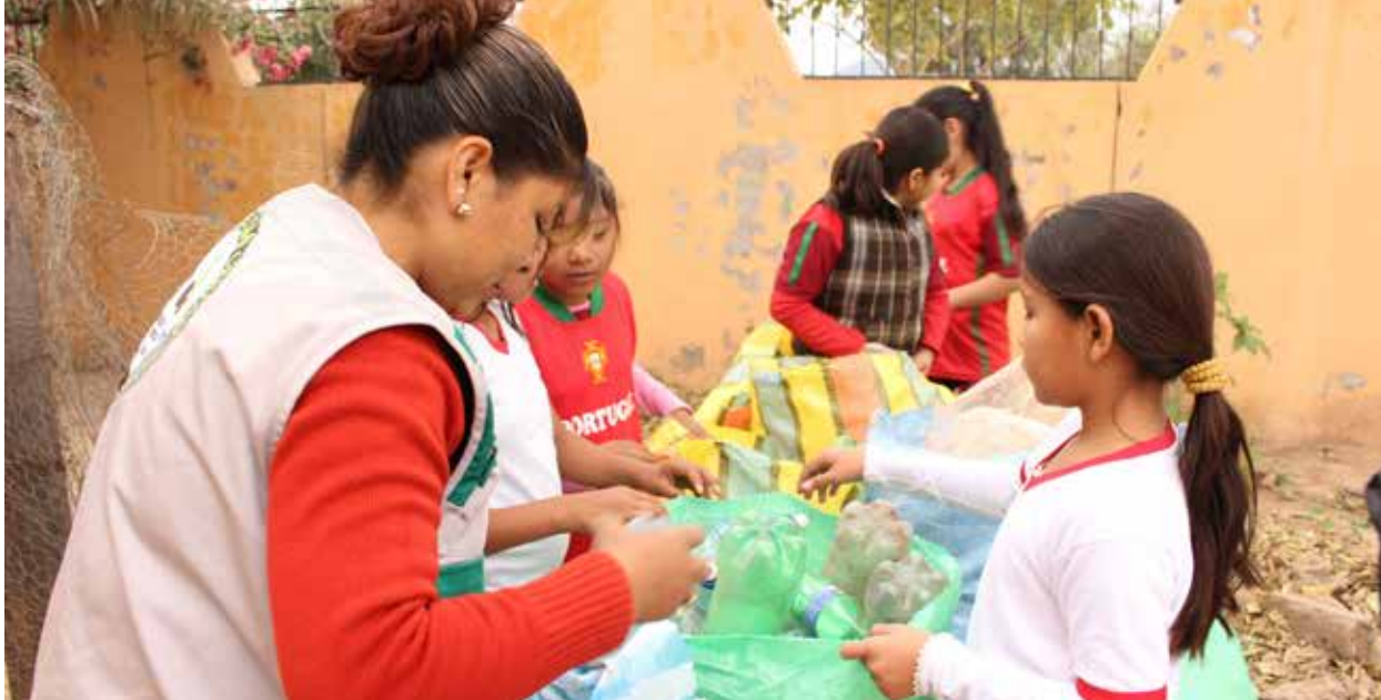
Campamento de reciclaje de plásticos en el Chaco.